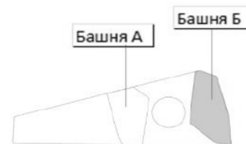
Башня Б. План 20 этажа